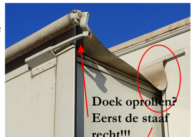
Doek oprolen? Eerst de staaf recht!!!