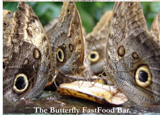
The Butterfly FastFood Bar.