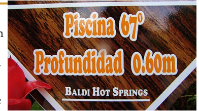
67grC. Voor wie het koud heeft!

In de auto zingen de kinderen uit volle borst een sesamstraatliedje mee: ".dartelt in het zonnetje, strijkt neer op een balkon-