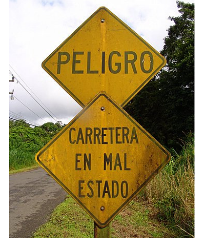
Hebben we niets van gemerkt!!!!