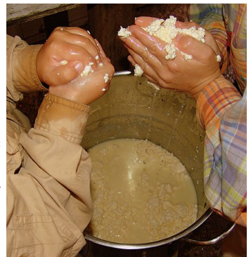
Stap 2: Vocht uitpersen