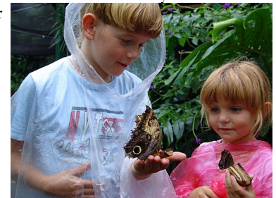
netje..'kwou dat ik zo'n vlinder was, 'kwou dat ik zo'n vlinder was'".