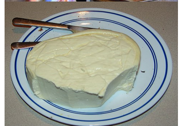
Het eindresultaat: 1 kilo kaas.