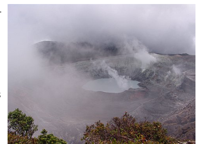
10 minuten later !!