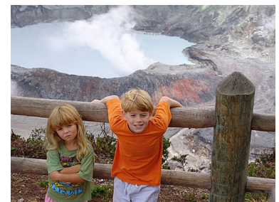
Juist voordat de mist toeslaat.