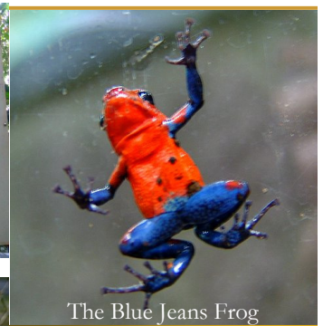
The Blue Jeans Frog

Op geluk moet je niet wachten, Je moet het tegemoet gaan